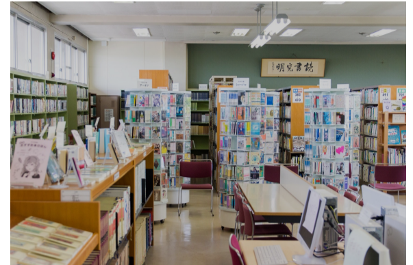
静けさに包まれた配架スペース (2019年5月撮影)

徒会OBOGが中心となって運営補助を行う予定だ。卒業生ブースに興味のある卒業生は、8月25日(日)にサポーターズミーティングがあるのでぜひ参加してほしい。詳細は本紙の各公式SNSアカウントまで。